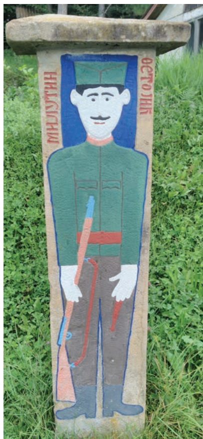
Спомен браће Остојића, Милутина и Радојице