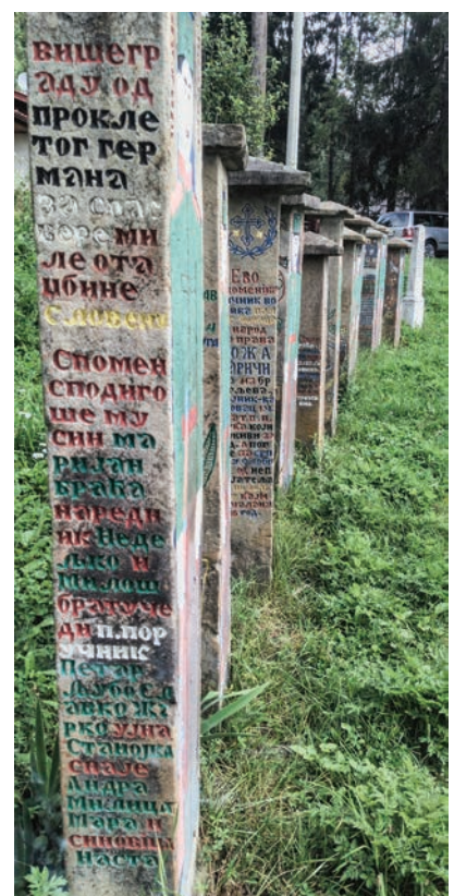
Спомен Михаила Б. Лазовића