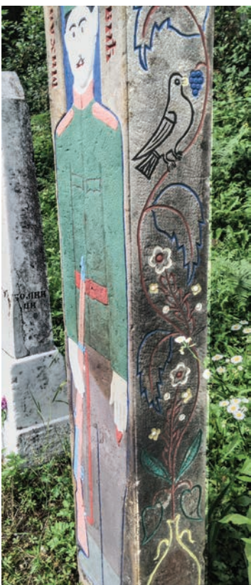
Спомен Михаила Б. Лазовића