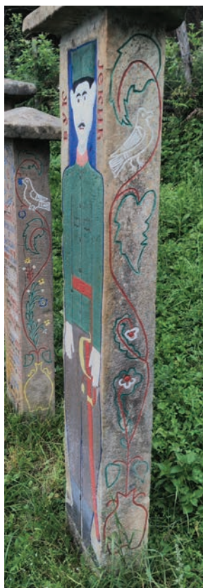
Спомен Вука Јекића