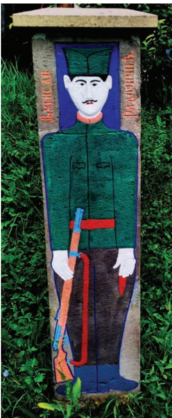
Спомен Љубисава Радојичића