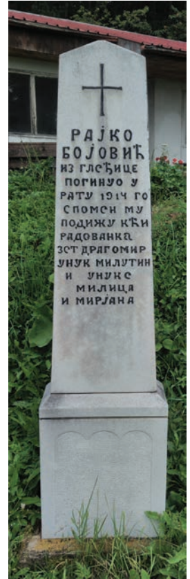
Спомен Рајка Бојовића