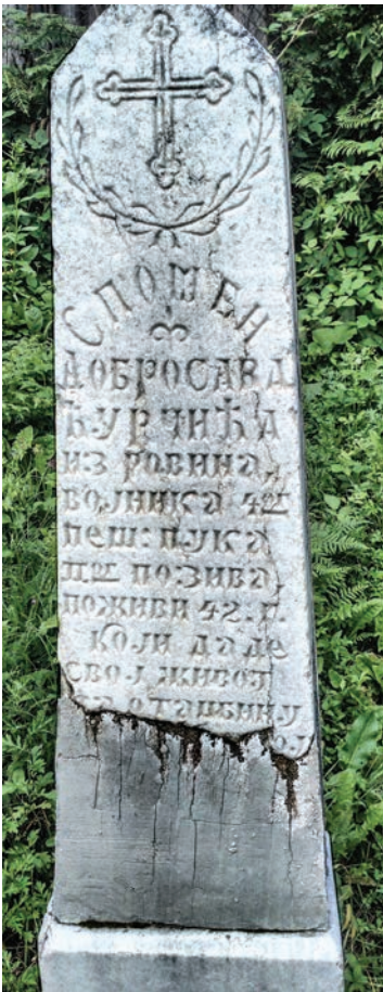
Спомен Добросаву Турчића