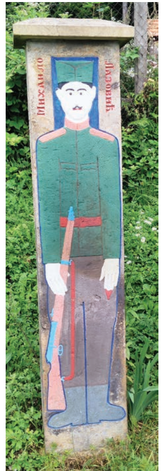
Спомен Михаила Б. Лазовића