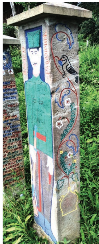
Спомен Љубисава Радојичића