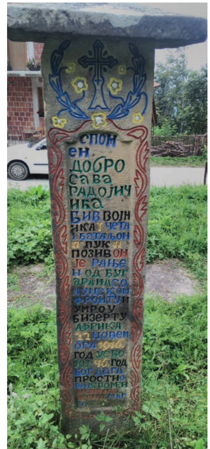
Спомен Добросава Радојичића