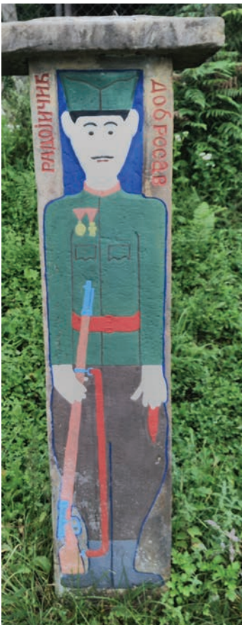
Спомен Добросава Радојичића