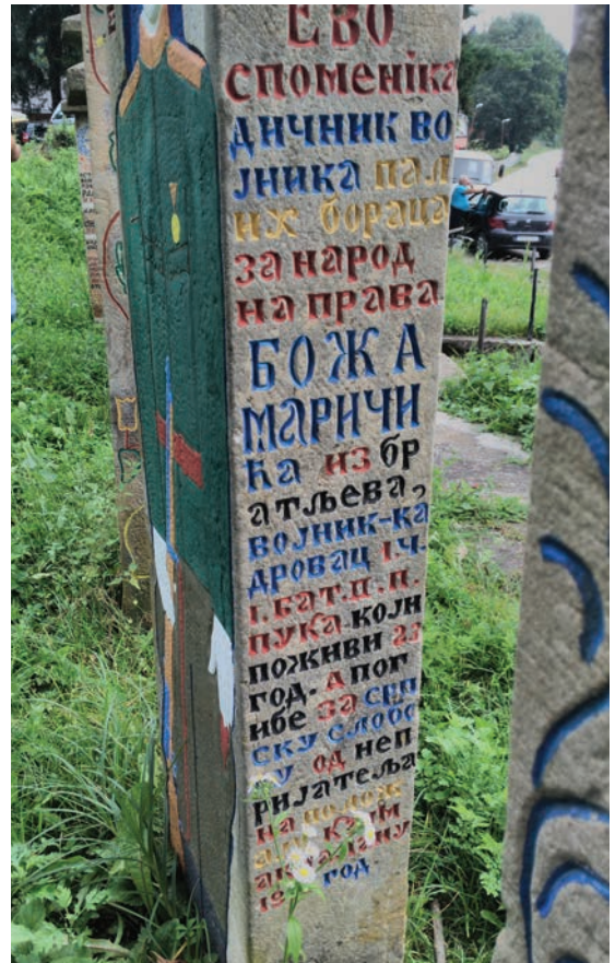
Спомен браће Маричића, Боже и Милете