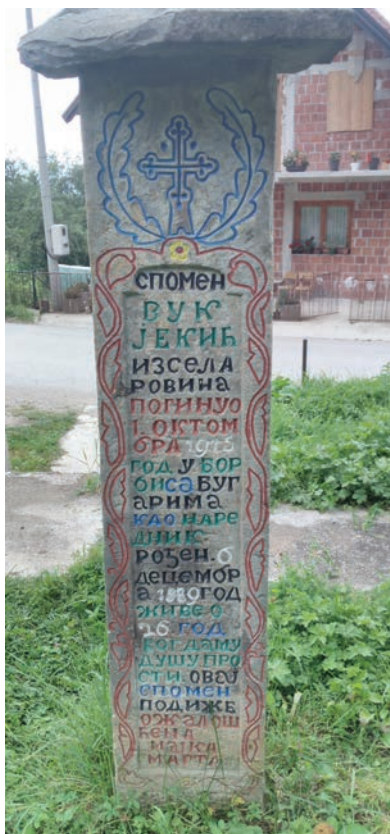
Спомен Вука Јекића