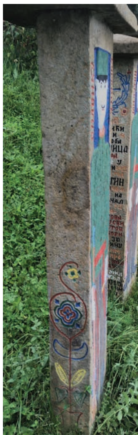
Спомен Миленка Ђуровића