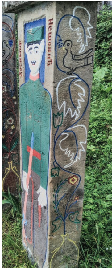
Спомен Десимира Нешовића