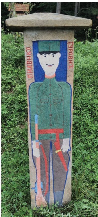
Спомен Миленка Ђуровића