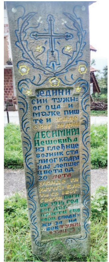
Спомен Десимира Нешовића