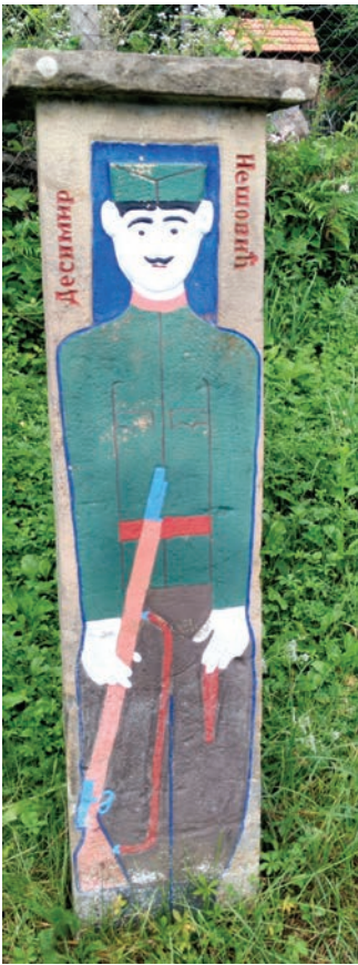
Спомен Десимира Нешовића