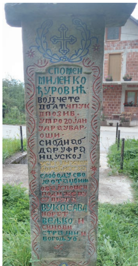
Спомен Миленка Ђуровића