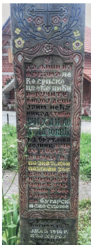
Спомен Михаила Б. Лазовића