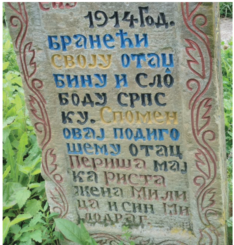
Спомен Миљка Јеротијевића