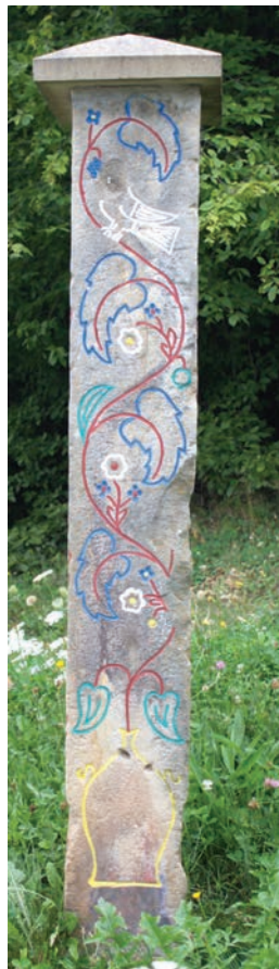
Спомен Алексе Марића