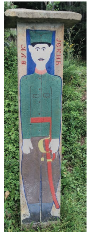
Спомен Вука Јекића