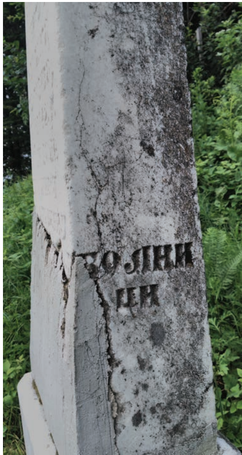
Спомен Добросаву Турчића