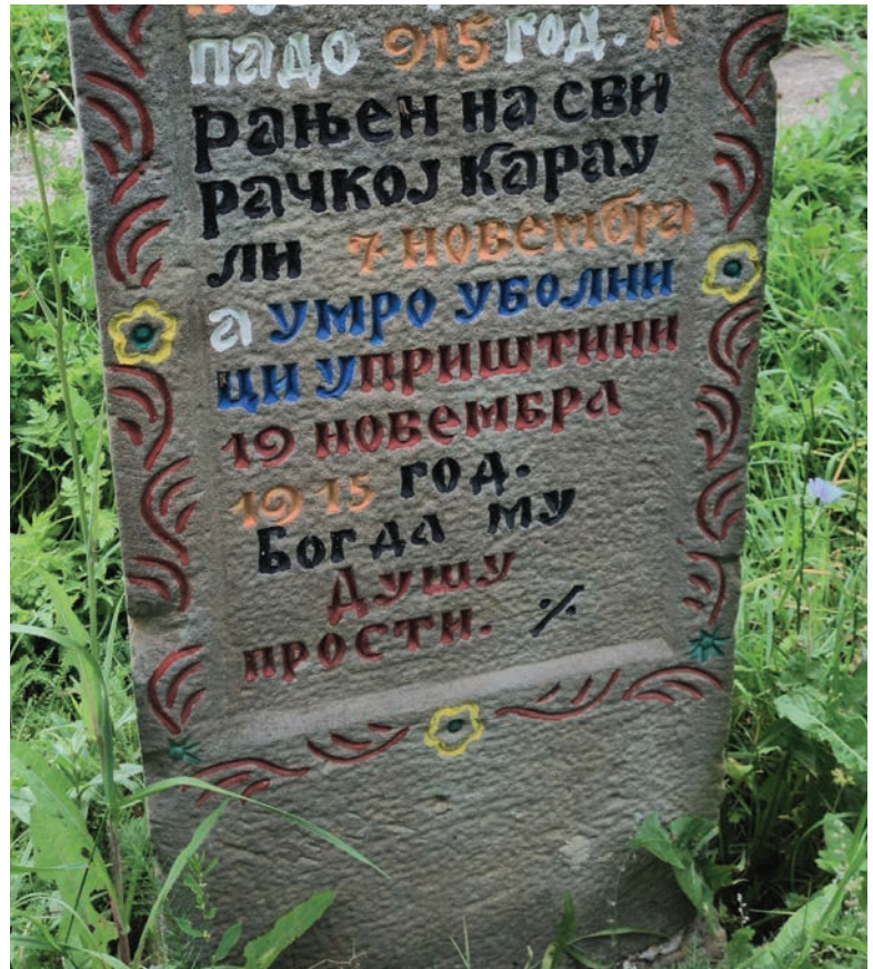
Спомен Љубисава Радојичића (доњи део)