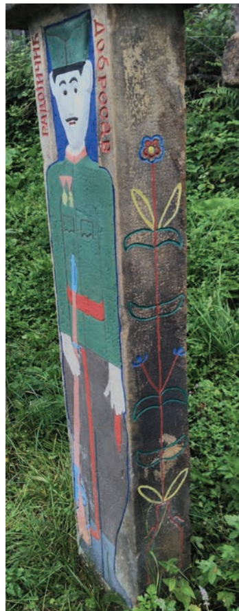
Спомен Добросава Радојичића