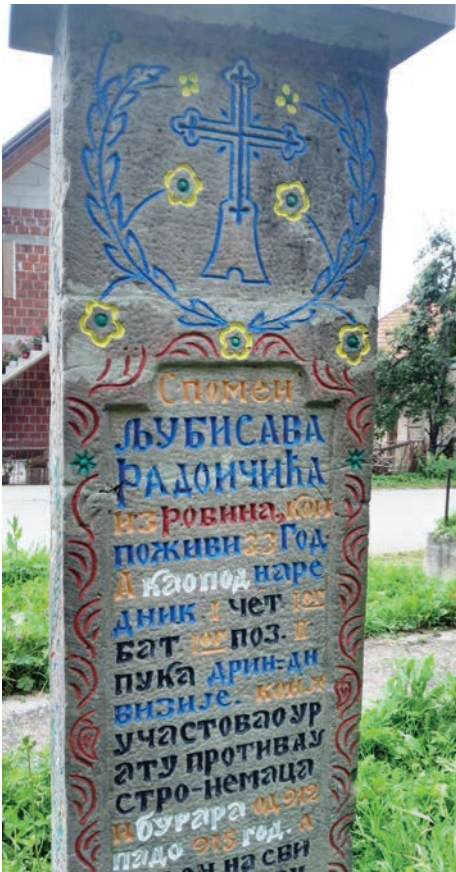
Спомен Љубисава Радојичића