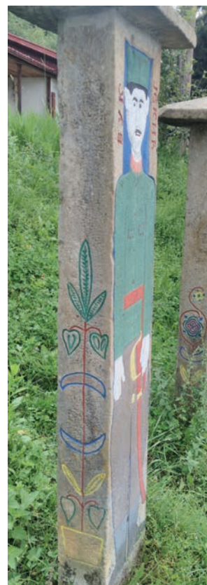
Спомен Вука Јекића