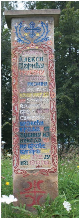
Спомен Алексе Марића