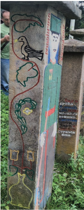
Спомен Добросав Радојичића