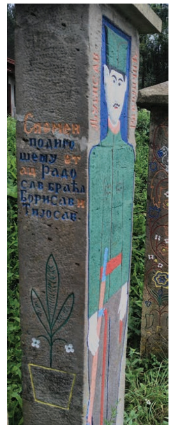
Спомен Љубисава Радојичића