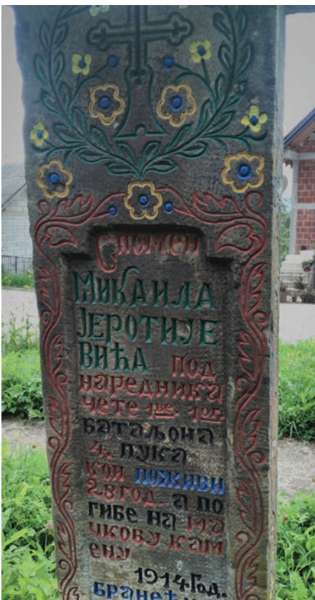
Спомен Миљка Јеротијевића