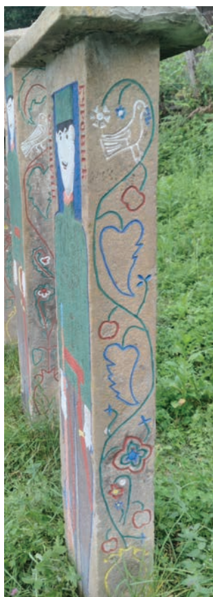
Спомен Миленка Ђуровића