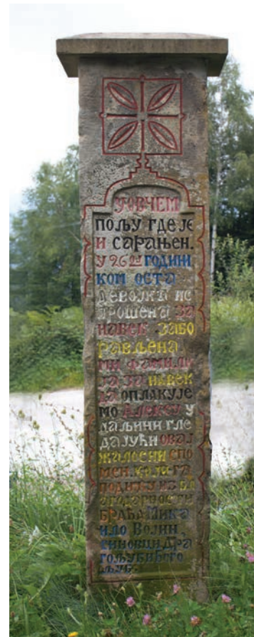
Спомен Алексе Марића