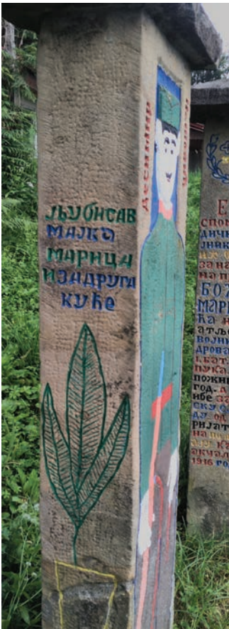
Спомен Десимира Нешовића