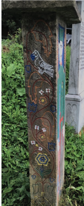
Спомен Миљка Јеротијевића