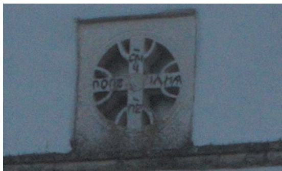
Сл. I Натпис на розети о попу Илији