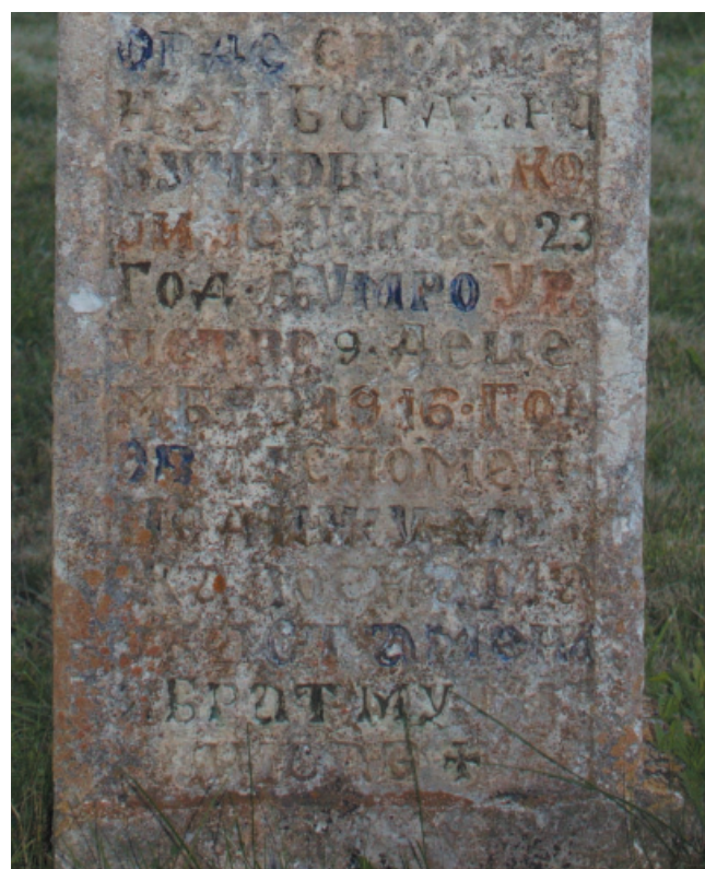
Сл. IV -2: ц Натпис Богдана Вучковића

IV -2: ц |1| Овде спо⟨..⟩ |2| њем Богдана |3| Вучковића ко |4| ји је живео 23 |5| год[ине]. А умро у ро |6| пство 9. деце |7| мбра 1916. год[ине]. |8| Овај спомен |9| подижу му |10| жалосна ма |11| ⟨јка⟩ Стамена |12| брат му |13| ⟨..⟩ с⟨..⟩ е. †