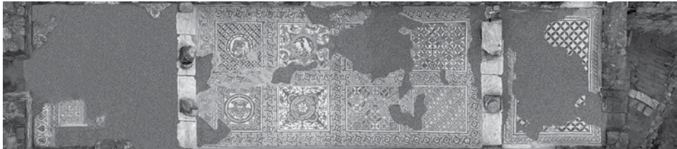
Сл. 8 Остаци мозаичке декорације нартекса Епископске базилике у Стобију, касни 5. или рани 6. век