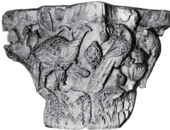
Сл. 2 Капител са представом пауна, поглед на конфронтирани пар пауна приказаних око кантароса, средина 5. века, сивечки доломит, 73 × 50 cm, абакус 73 cm, Народни музеј Србије (R. F. Hoddinott, Early Byzantine Churches in Macedonia and Southern Serbia, A Study of the Origins and the Initial Development of East Christian Art , Toronto & New York, 1963, Pl. 38, e)

Fig. 1 Capital containing the image of a peacock, the middle of the 5 th century, dolomite from Sivec, 73 × 50 cm, abacus 73 cm, the National Museum in Belgrade (P. Niewohner, Byzantine Ornaments in Stone: Architectural Sculpture and Liturgical Furnishings , Berlin, 2021, 53, Fig. 124)