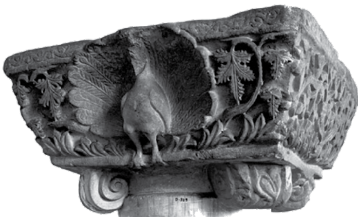
Сл. 5 Јонски импост капител са представом пауна раширеног репа, Археолошки музеј у Истанбулу, инв. 2655 (P. Niewohner, Byzantine Ornaments in Stone: Architectural Sculpture and Liturgical Furnishings , Berlin, 2021, 53, Fig. 123)