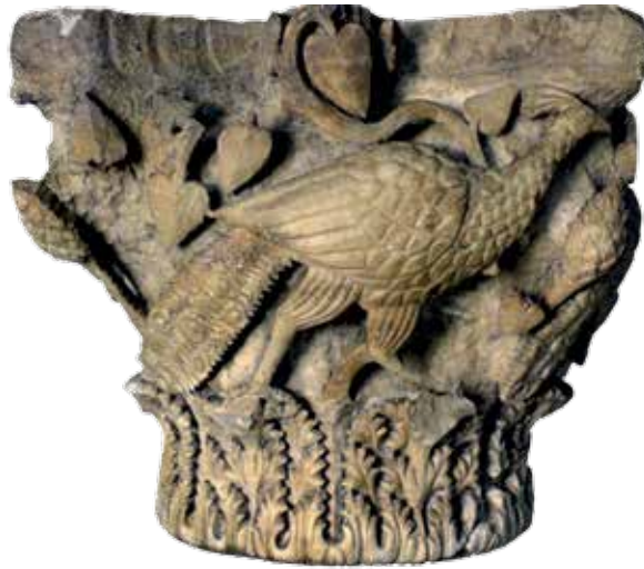
Сл. 1 Капител са представом пауна, средина 5. века, сивечки доломит, 73 × 50 cm, абакус 73 cm, Народни музеј Србије (P. Niewohner, Byzantine Ornaments in Stone: Architectural Sculpture and Liturgical Furnishings , Berlin, 2021, 53, Fig. 124)

Fig. 1 Capital containing the image of a peacock, the middle of the 5 th century, dolomite from Sivec, 73 × 50 cm, abacus 73 cm, the National Museum in Belgrade (P. Niewohner, Byzantine Ornaments in Stone: Architectural Sculpture and Liturgical Furnishings , Berlin, 2021, 53, Fig. 124)