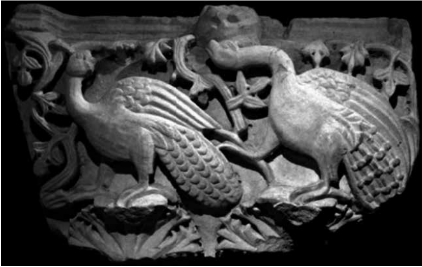
Сл. 3 Капител пиластера са представом пауна у оквиру разгранате лозице, крипта цркве Св. Димитрија у Солуну, 5. век (P. Niewohner, Byzantine Ornaments in Stone: Architectural Sculpture and Liturgical Furnishings , Berlin, 2021, 53, Fig. 125)

Fig. 3 Capital of a pilaster containing the representation of a peacock framed by branching vines, the crypt of the Church of St Demetrios in Thessaloniki, the 5 th century (P. Niewohner, Byzantine Ornaments in Stone: Architectural Sculpture and Liturgical Furnishings , Berlin, 2021, 53, Fig. 125)