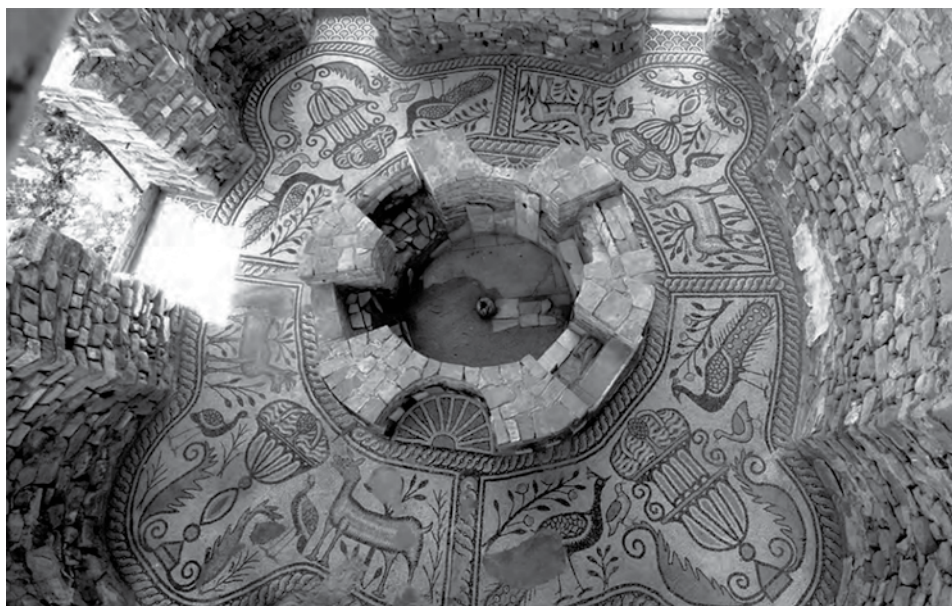
Сл. 6 Подни мозаик баптистеријума Епископске базилике у Стобију, касни 4. или рани 5. век (S. Blaževska, M. Tutkovski, "Episcopal Basilica in Stobi", in: Early Christian Wall Painting from the Episcopal Basilica in Stobi , eds. E. Dimitrovska, S. Blaževska i M. Tutkovski, Stobi, 2012, 17)