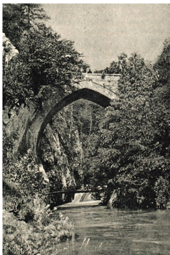
слика 1: Хајнрих Ренер, снимљено 1896. године 5