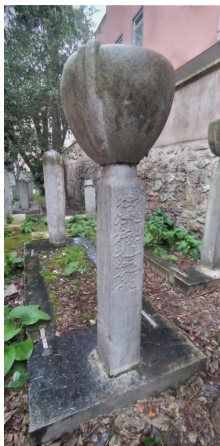
слика 6: гроб Сулејман-паше