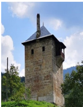
слика 3: Рецеп-пашина кула

Рецеп-пашина кула у Жепи изграђена је у делу села, који се по њој зове Кула. У односу на њу, на супротној страни реке, на стрмој литици, налазе се остаци средњовековног утврђења Вратар, које је у Земљи Ковачевића било средиште Жупе Вратар, а у османском периоду истоимене нахије. Рецеп-пашина кула је спољних димензија 6,54 x 6,65 cm; има подрум и три надземна нивоа, од којих су прва два с пушкарницама служила за одбрану, а трећи с прозорима и док-сатом за становање. Трећи ниво је засвођен каменом куполом, преко које је постављена шаторна дрвена конструкција покривена шиндром. Рецеп-пашина кула у Жепи је међу 15 кула у Босни и Херцеговини, које су проглашене за национални споменик. 18 Ни Жепљани, ни стручњаци, не знају ко је био тај Рецеп-паша, као ни када је кула изграђена.