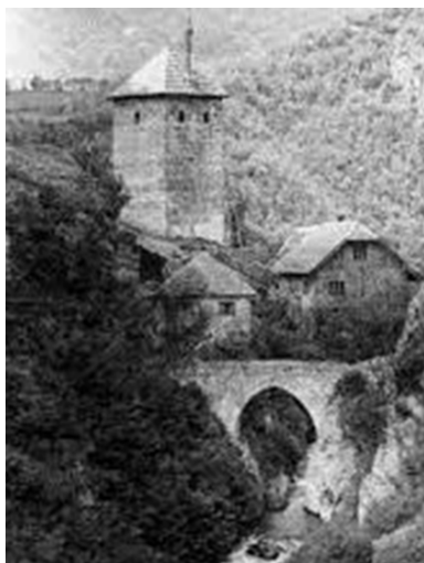
слика 2: мост премештен узводно код Реџеп-пашине куле

Крајем 19. века на мост је случајно наишао аустријски новинар Хенрик Ренер. Он се спуштајући сплавом низ Дрину, искрцао код великих букова у Слапу, које су путници и сплавари пешке заобилазили. После пентрања уз стрму стеновиту обалу, Ренер је угледао сјајан приказ и тако је настала прва фотографија моста на Жепи (слика 1). Ренер је тада забележио: „Усред пустоши диван каменит мост прелази жепску гудуру у једном јединственом смионом луку. 6 ” Већ видевши бројне мостове Мехмед-паше Соколовића и његових рођака, Ренер је и жепски мост приписао чувеном великом везиру. 7