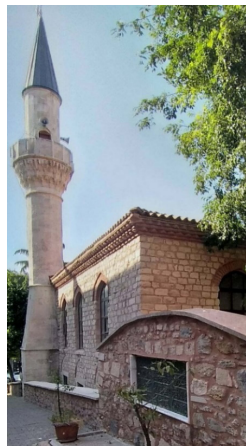
слика 7: џамија у Ускудару

Топал Реџеп-паша је сахрањен на азијској страни Истанбула, у делу Ускудара, названом по соколарима Доганџилар. Ту је вероватно већ постојао неки верски објекат чији је задужбинар био он, или неки његов близак рођак. Године 1677. на том месту је обновљена или изграђена и сада постојећа џамија Шехита Сулејман-паше, великог везира родом из Хисарџика код манастира Милешева. 68 У дворишту џамије и сада постоје два суседна гроба некадашњих великих везира, земљака, а можда и рођака (слике 5. и 6).