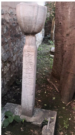
слика 5: гроб Рецеп-паше 67

његовог убиства, султан Мурат IV сурово се обрачунао с побуњеницима и почео сам да влада, започевши врло успешан период османске историје, у којем су поново освојени Багдад и Тебриз и враћен ред у све османске провинције.