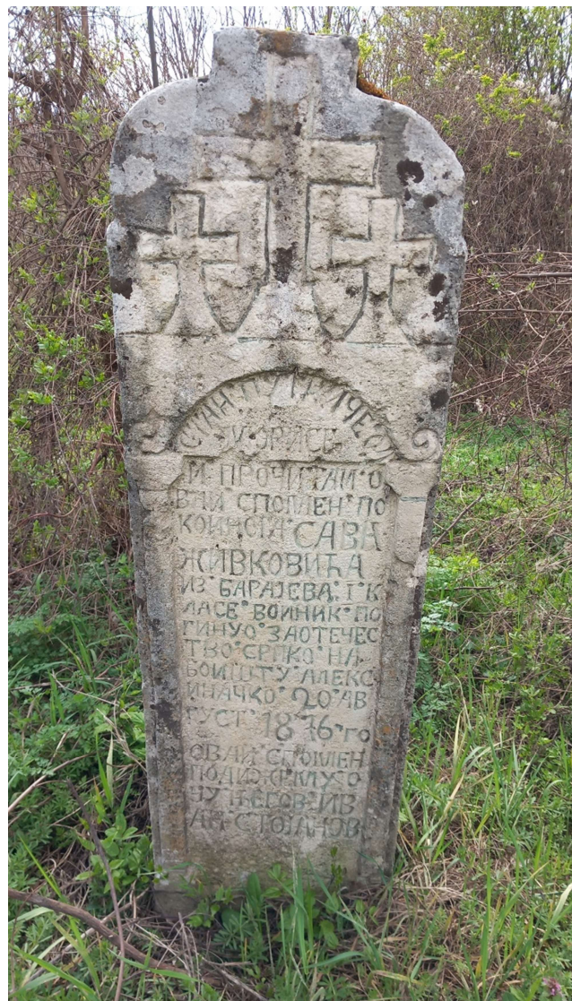
Сл. 3 Споменик Сава Живковића

Споменик Сава Живковића, највећи је и најбоље очуван из ове групе. Обликом, украсима, начином извођења натписног поља и садржајем текста доста сличи претходно описаном, па