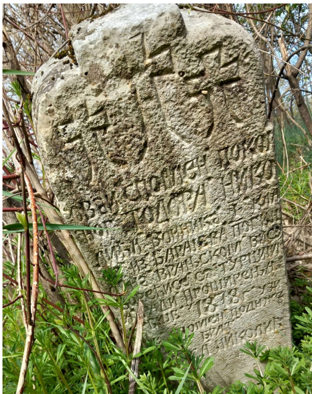
Сл. 4 Споменик Тодора Николића

Војник Тодор Николић, коме је посвећен овај спомен, био је учесник у Српско–турским ратовима, а погинуо је 1878. године на Врањском вису. Његов крајпуташ садржи, изнад натписног поља, које није удубљено, и приказ три крста, док се испод њих налази текст садржан у једанаест редова (сл. 4):