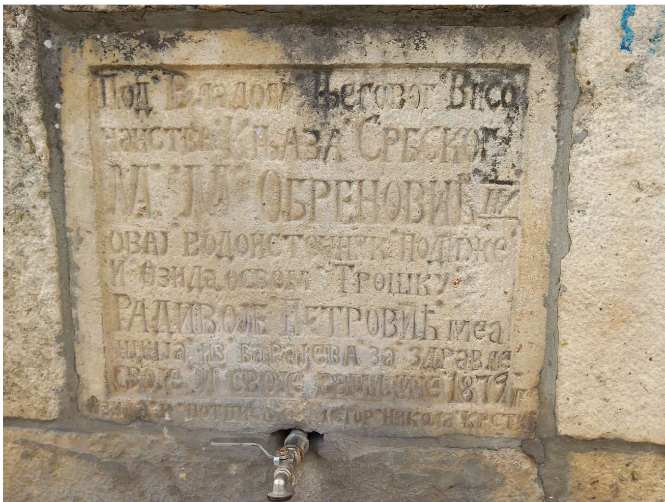
Сл. 5 Чесма Радивоја Петровића