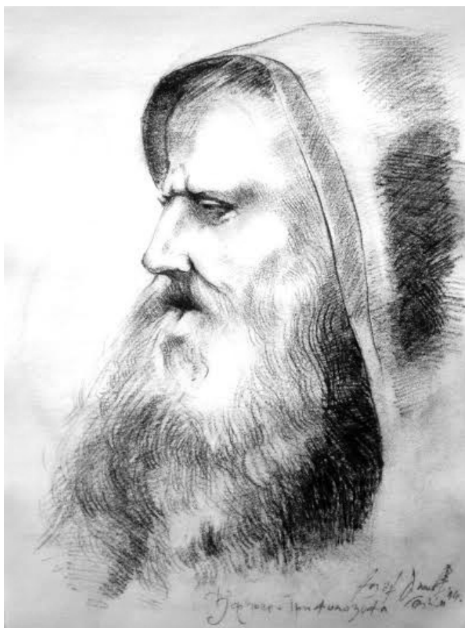
Стојан Анички Оки, Портрет старца