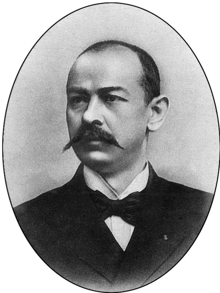
Јанко Веселиновић, књижевник (Црнобарски Салаш, 1862 – Глоговац, 1905)