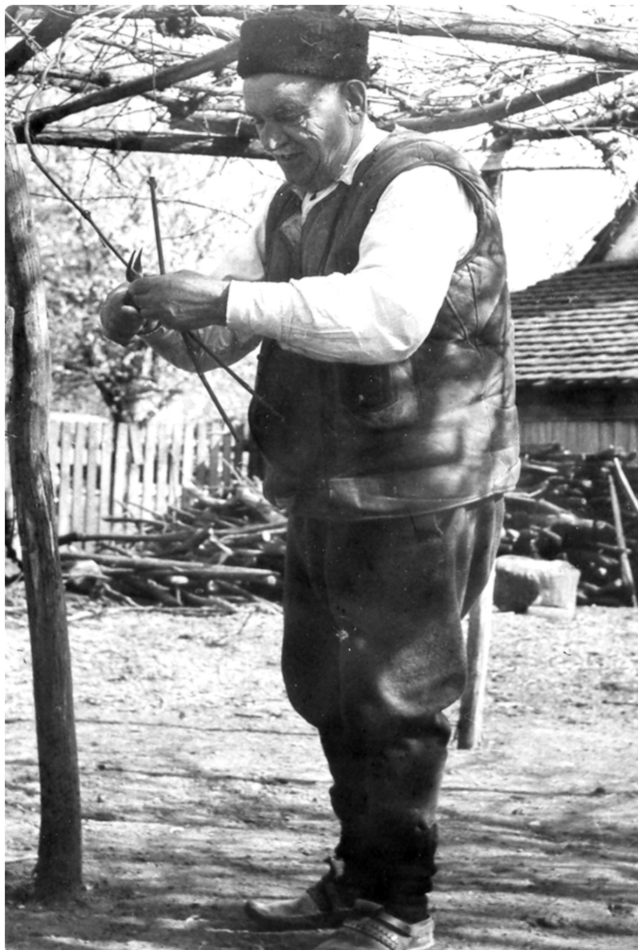
Мачванин (Народни музеј, Шабац)