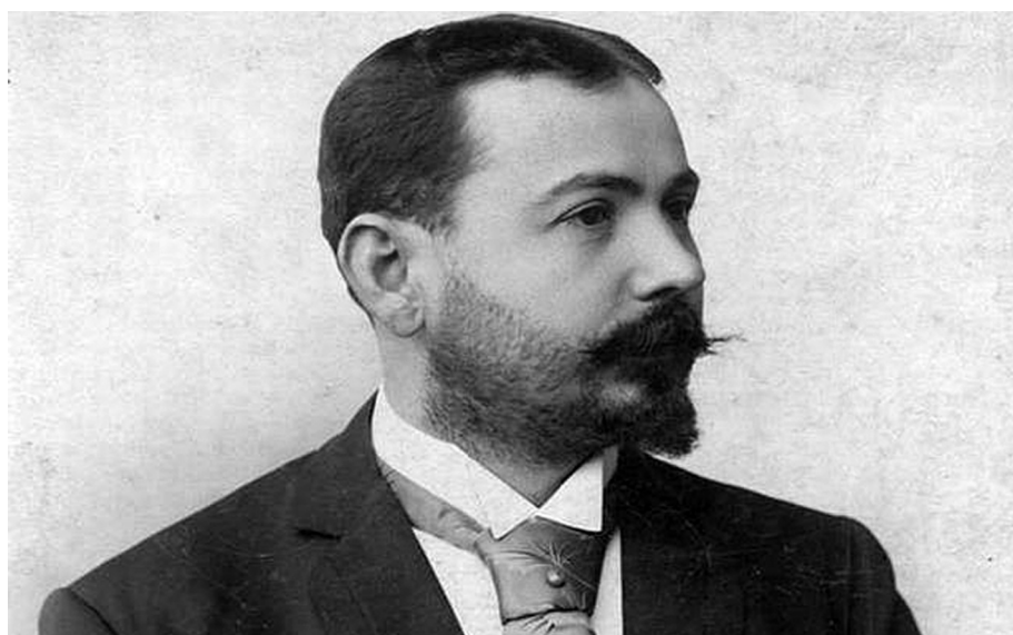
Милорад Рувидић, архитекта (Липолист, 1860 – Београд, 1914)