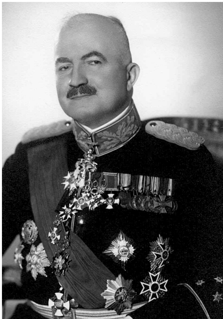
Пантелија Јуришић, генерал (Црна Бара, 1881 – Београд, 1960)