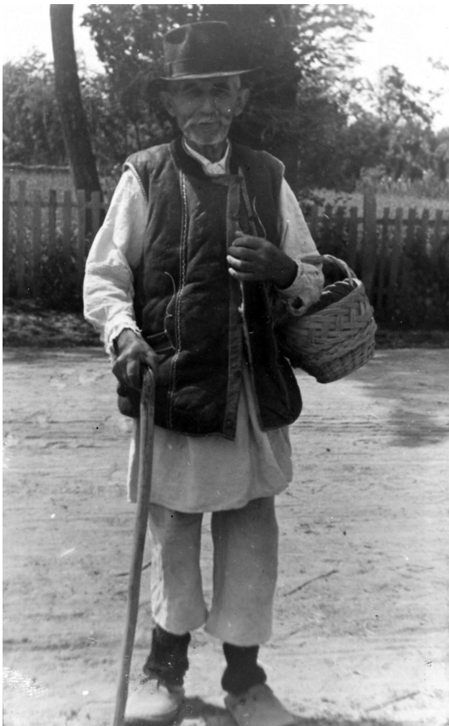
Човек из шабачког краја (Народни музеј, Шабач)