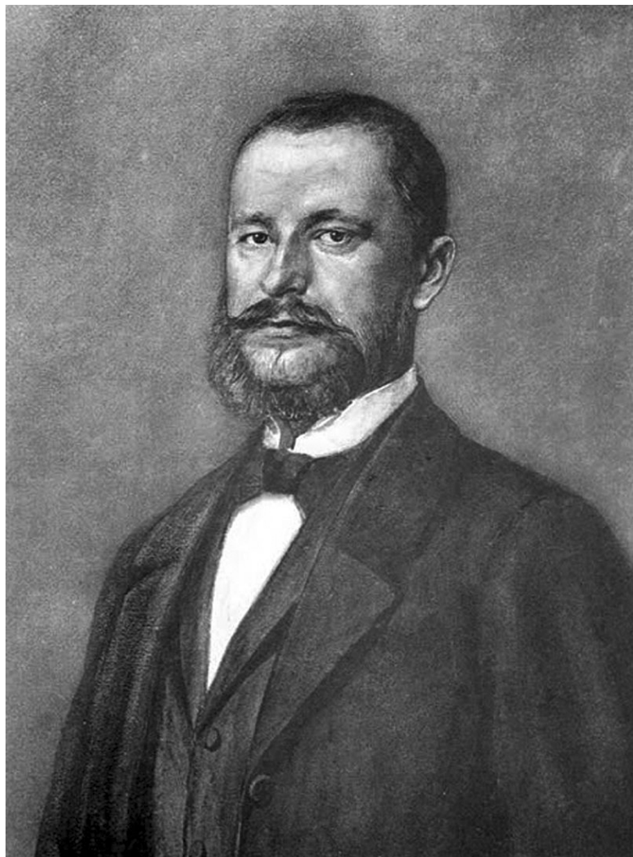
Милош Милојевић, историчар (Црна Бара, 1840 – Београд, 1897)