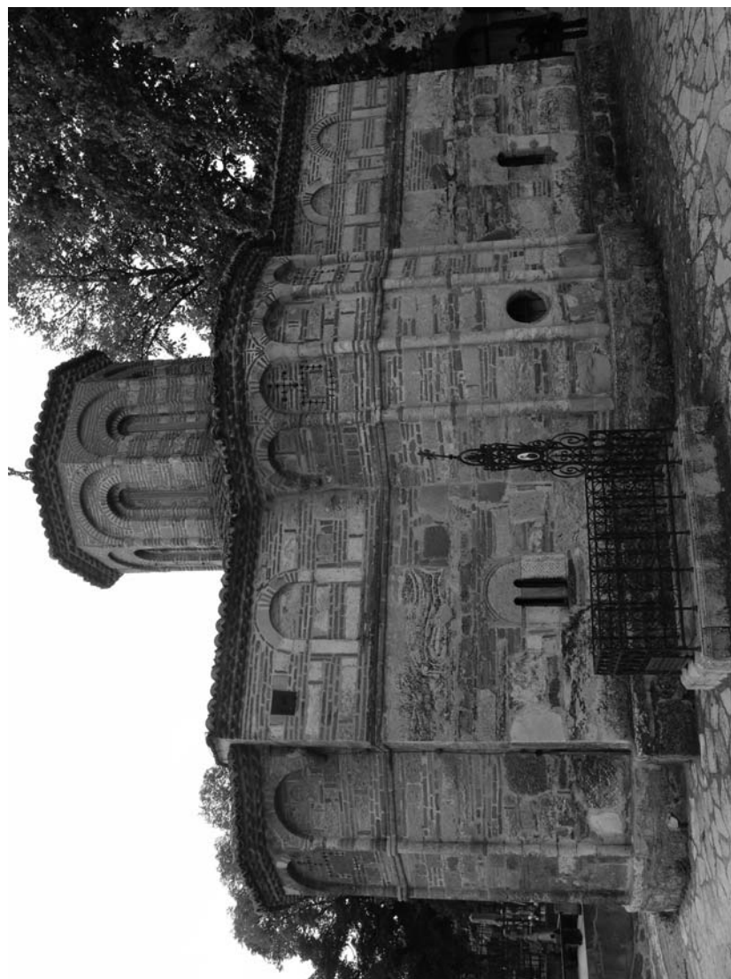
Сл. 1, Црква Усијење Пресвете Богородице у Смедереву