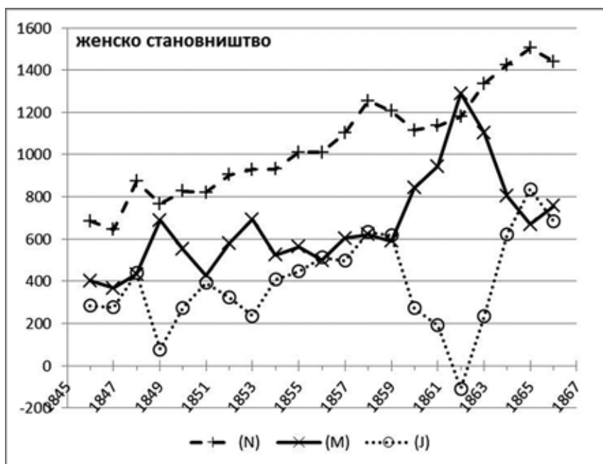
Графикон 2. Природно кретање становништва женског пола 1846–1866.