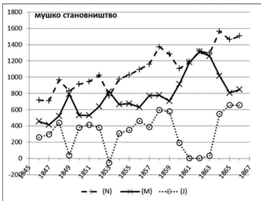
Графикон 3. Природно кретање становништва мушког пола 1846–1866.