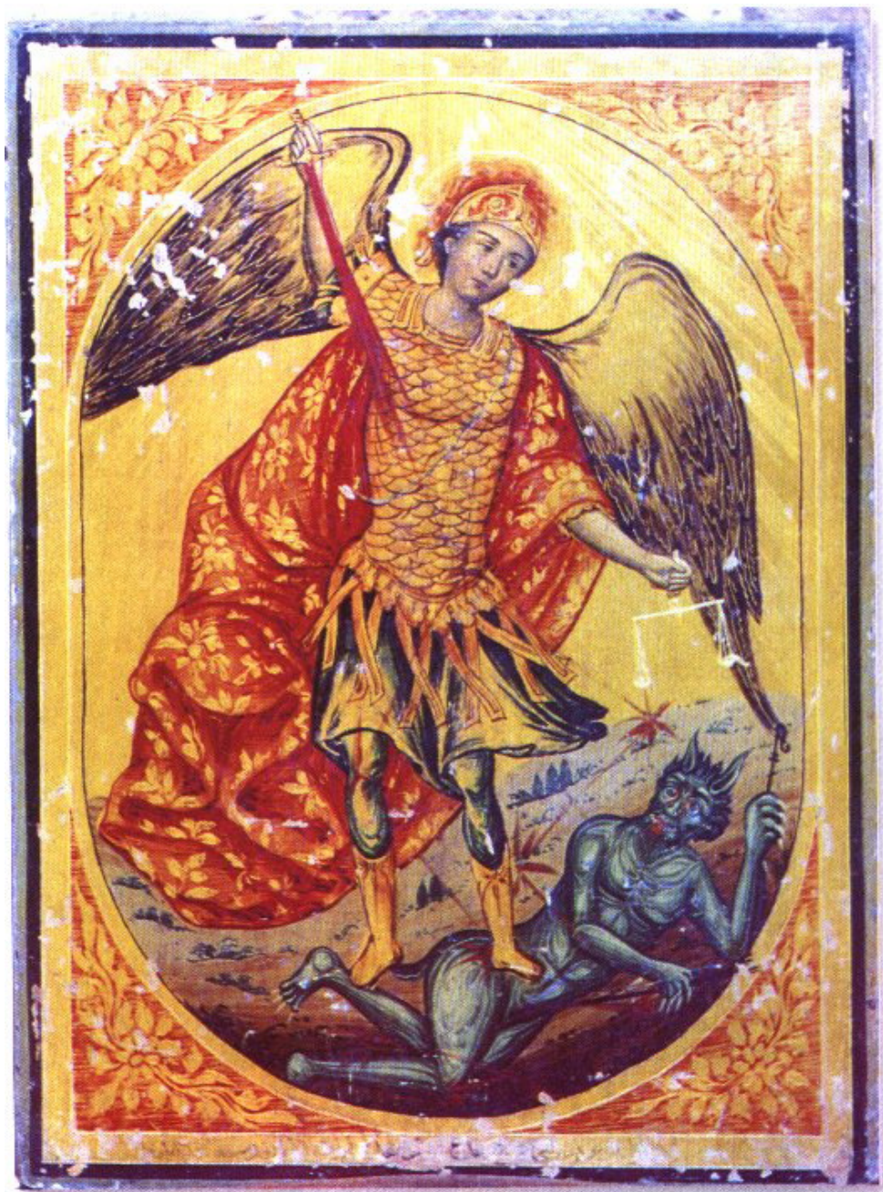
Слика 3: Архангел Михаило убија Бавола мачем у облику репа комете, представљени на икони из Сирије (Athnasiyu, 2002).