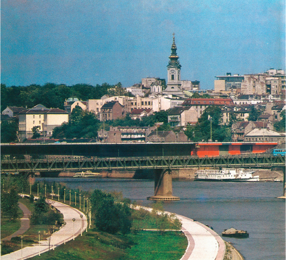
A view of the right bank of the Sava river Belgrade , monographs of Turistička štampa, Belgrade 1983, str. 4.