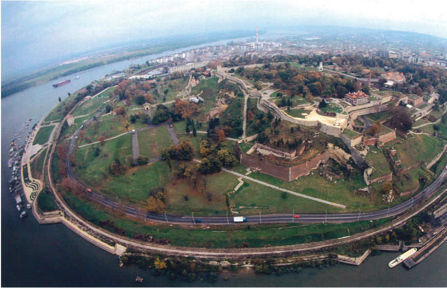
Београдска тврђава, општи изглед М. Поповић, Београдска тврђава , Београд 2006, стр. 28.