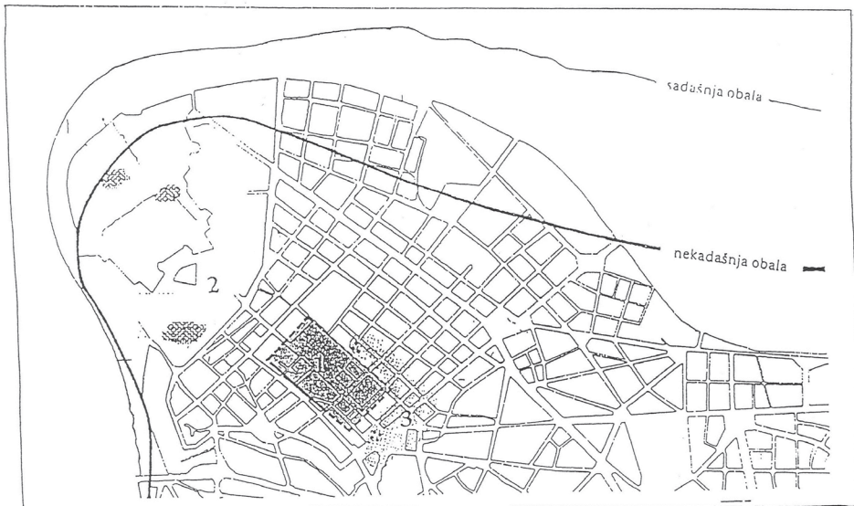
Топографски положај Сингидунума крајем 1. и у 2. веку Singidunum I , ed. М. Поповић, Београд 1997, сл. 3.