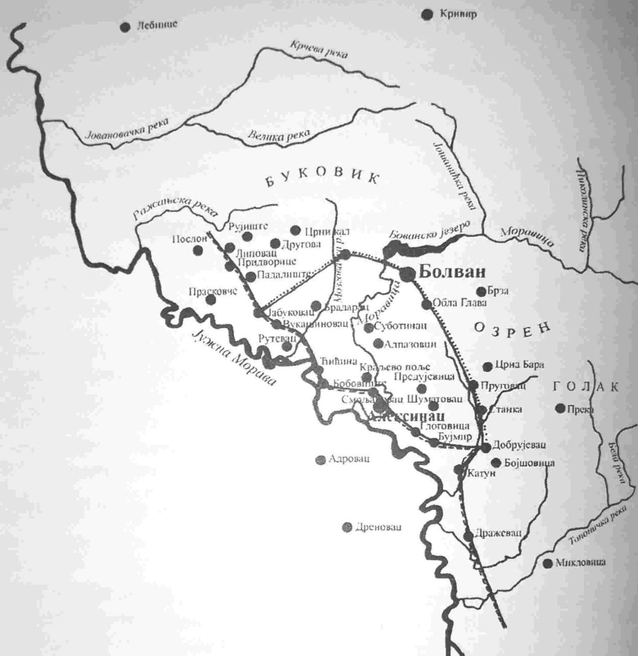
КАРТА 1. Бованска нахија са рутом деонице Цариградског друма и њеним алтернативним правцем 3

Од 1516. па до седамдесетих година 16. века, број насеља Бованске нахије варирао је од 39. до 43. Најмногољуднија насеља били су Бован и Алексинач. Већину становништва у нахији Бован чинили су хришћани. Муслимана је било мало и били су насељени само у Бовану, Алексиначу и још неколико села. 4