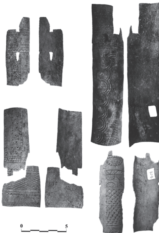
Рис. 2. Костяные украшения для колчанов, найденные на холме Трапезица, Велико-Тырново [42, с. 54].