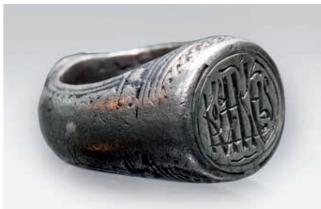
Fig. 94. Ring of nobleman Nikola Kosjer