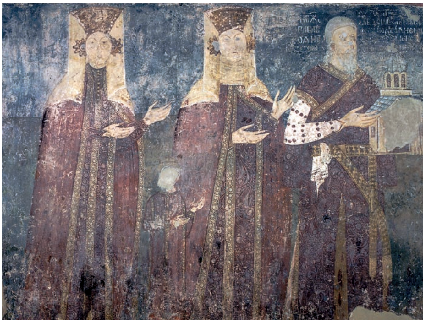
Fig. 92. Ktatorial composition from the White Church of Karan, 14 th century

rendering the remains of a luxurious dress of Italian fabric with vines embroidered on it in gold thread, discovered in St. Peter's Church near Novi Pazar in the 1960s (fig.93), 31 that much more significant. The special value of the fabric is demonstrated in the fact that it was reused for making a new dress, probably after the final collapse of the Serbian Despotate. 32 Similarly composed were the motifs on fabrics originating from Venice, which are today kept in Berlin, i.e. in St.