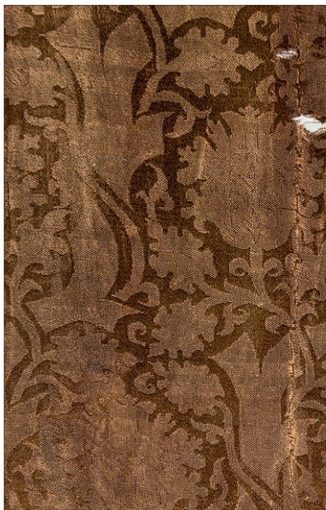
Fig. 93. Dress, detail, first half of the 15 th century, St. Peter's Church near Novi Pazar