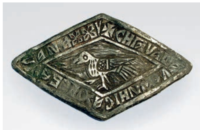
Fig. 95. Plaque from bowl of čelnik Hrebeljan

Like luxurious apparel and jewellery, a form of stressing the power and wealth of the Serbian aristocracy in medieval society was also the use of expensive dishes. Cups from the late Middle Ages which belonged to the nobility or rulers were mostly made of gilded silver and displayed outstanding craftsmanship. Certainly objects that had been specially made to order, they may have been a ruler's gift to a nobleman as a token of gratitude for loyal service. The precious ones were placed in storage and served as a pledge for survival in times of hardship. 50 An appliqué from such a cup was discovered in the narthex of the church in Velika Kruševica, in a grave that most likely belonged to the čelnik Hrebeljan. The owner of the discovered glass was engraved in the Serbo-Slavonic language: ѿ | ѿша ѿ ѿника хрѣбелана , which combined with stylised floral motifs framed the central field decorated with the motif of a bird (fig. 95). 51