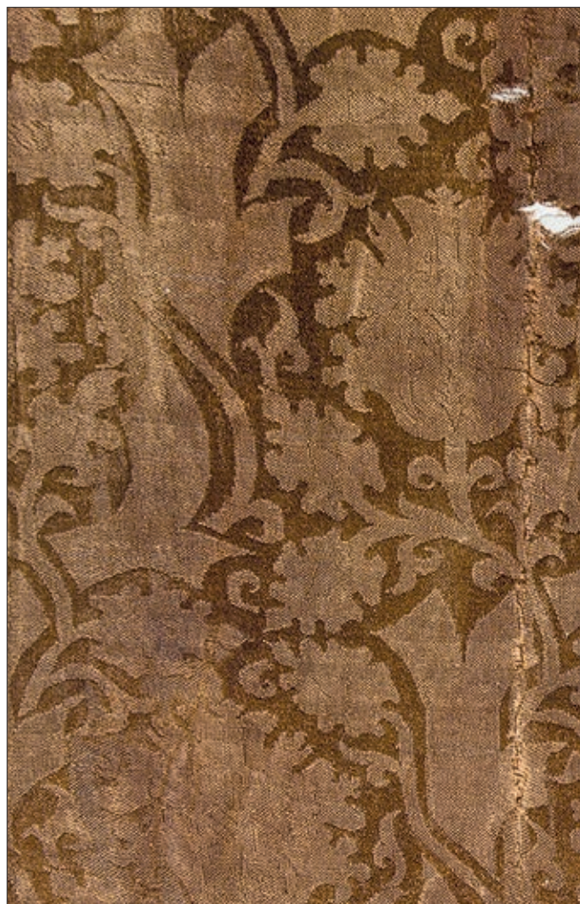
Сл. 93. Хаљина, детаљ, прва половина XV века, Петрова црква код Н. Пазара