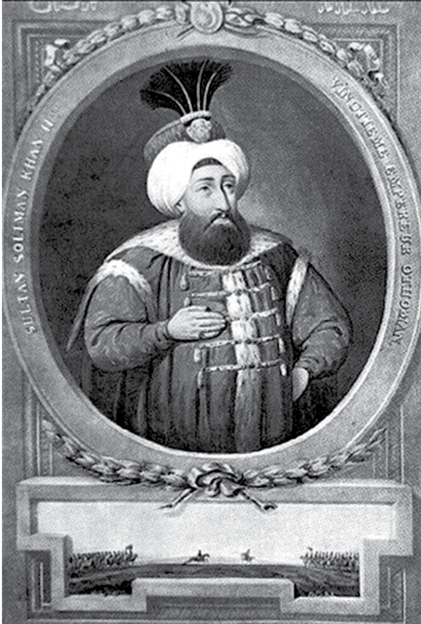
Sultan Sulejman II