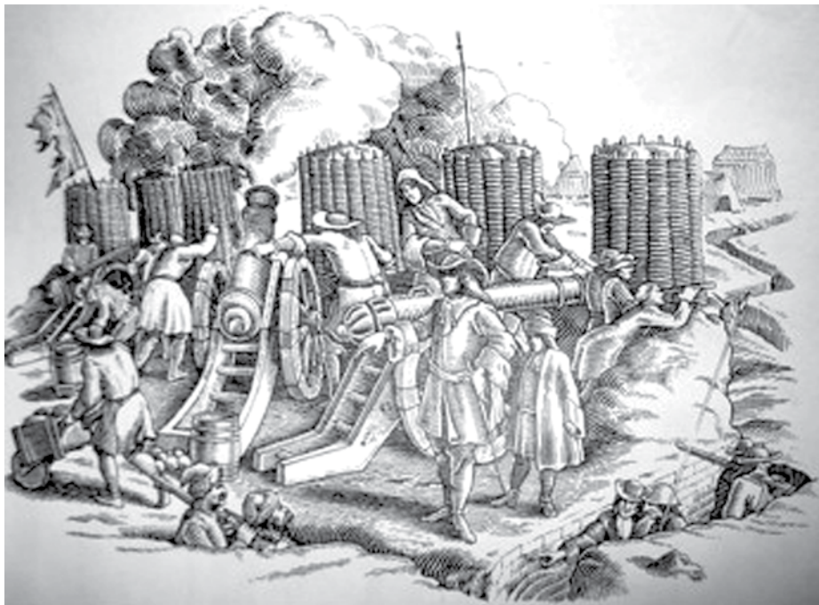
Hrišćanska artiljerija u akciji

iz Diyarbekira i zaostale anadolske odrede koje je terao Kemankeš Ahmed-paša. Ove jedinice upravo su stigle pod Niš i smestile se južno od tvrđave. 246