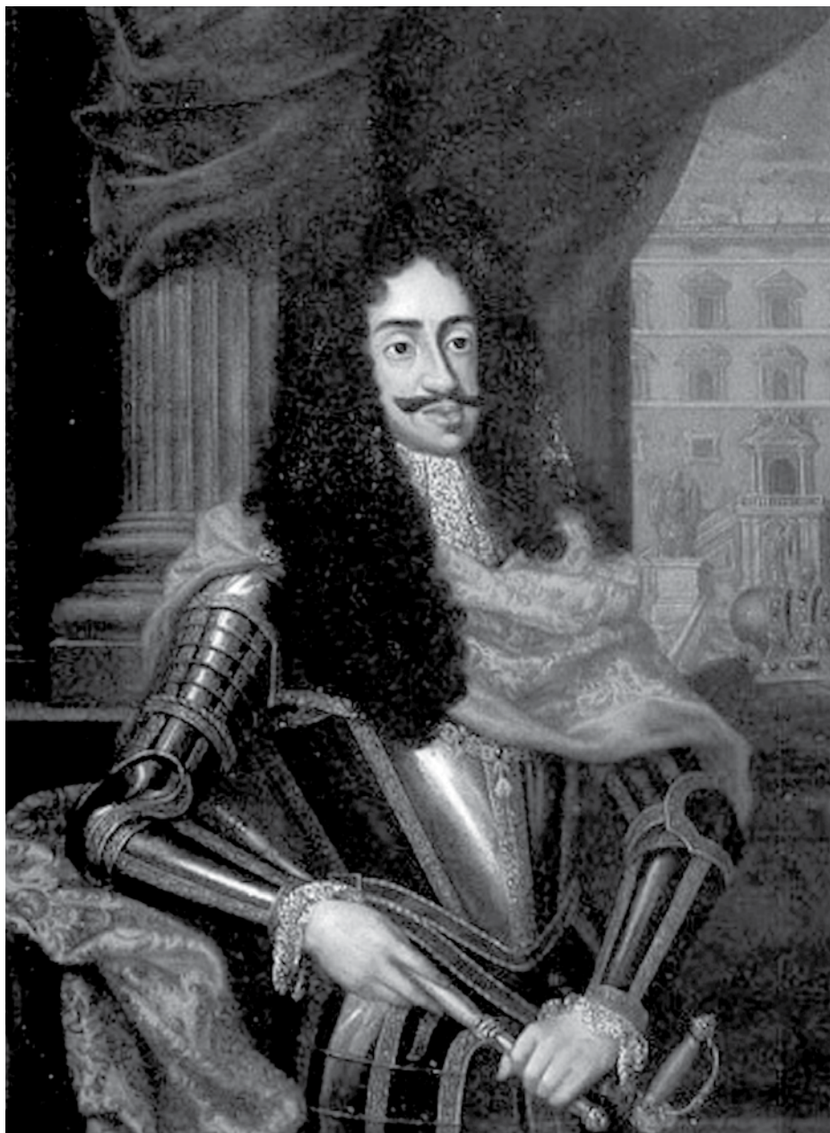
Car Leopold I