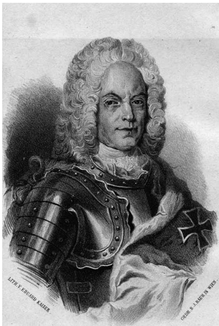
General Guido fon Štaremberg

Potom se pristupilo raščišćavanju i poravnavanju zemljišta. Najpre je tobđzijski odžak izvukao topove iz meterisa, natovario ih na kola, zajedno s topovskom municijom, i spremio za pokret. Ordudžije su počele da zatrpavaju mesta gde su bili meterisi i topovski bastioni. Njima su se pridružili i neki iz spahijskog i silahdarskog odžaka da bi što pre završili raščišćavanje terena oko gradskih bedema. 340